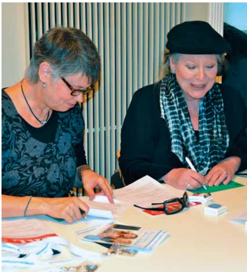
Her sættes en vinder-underskrift

er det samme, som at inklusionen er lykkedes.