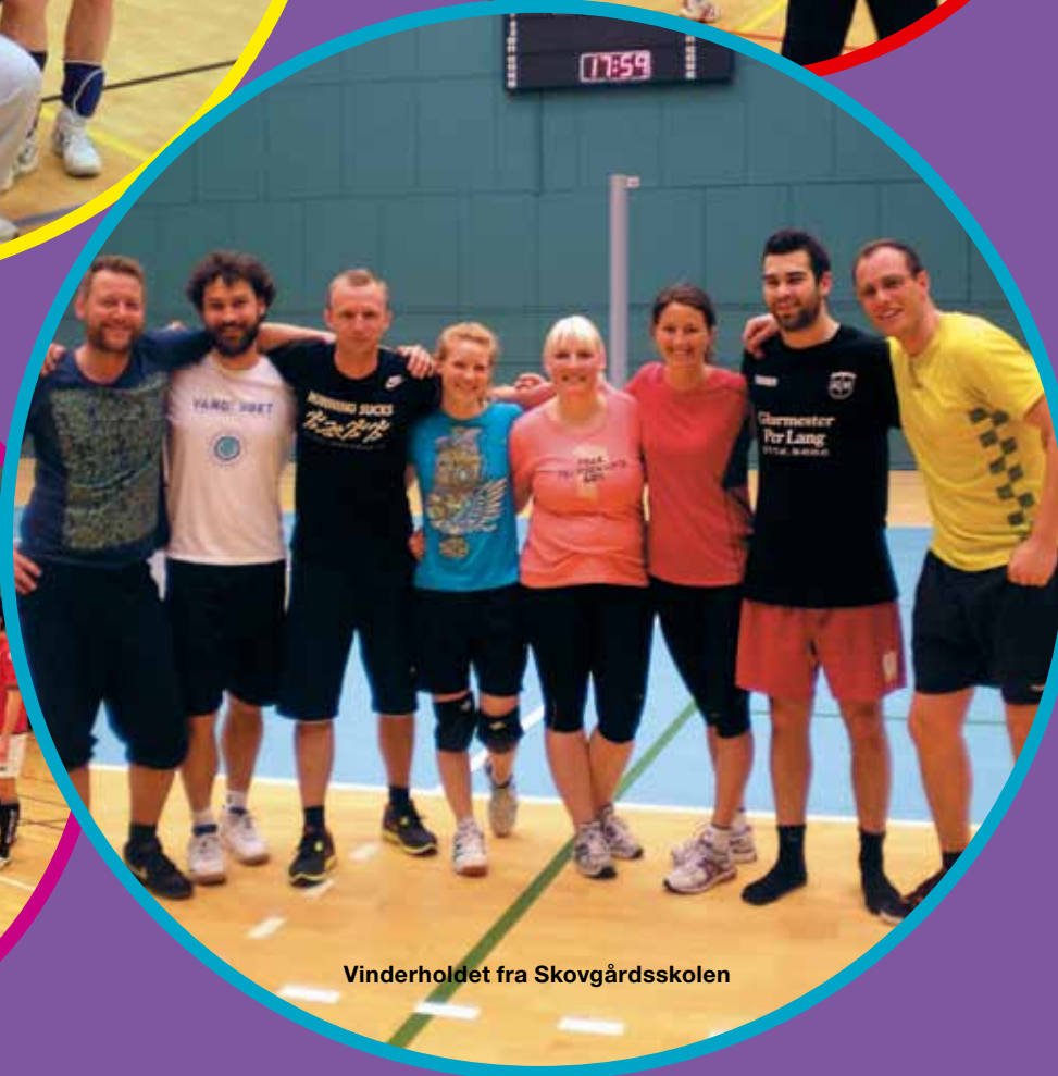
Vinderholdet fra Skovgårdsskolen

Hvem: Lærere og pædagoger ansat i Gentofte Kommune