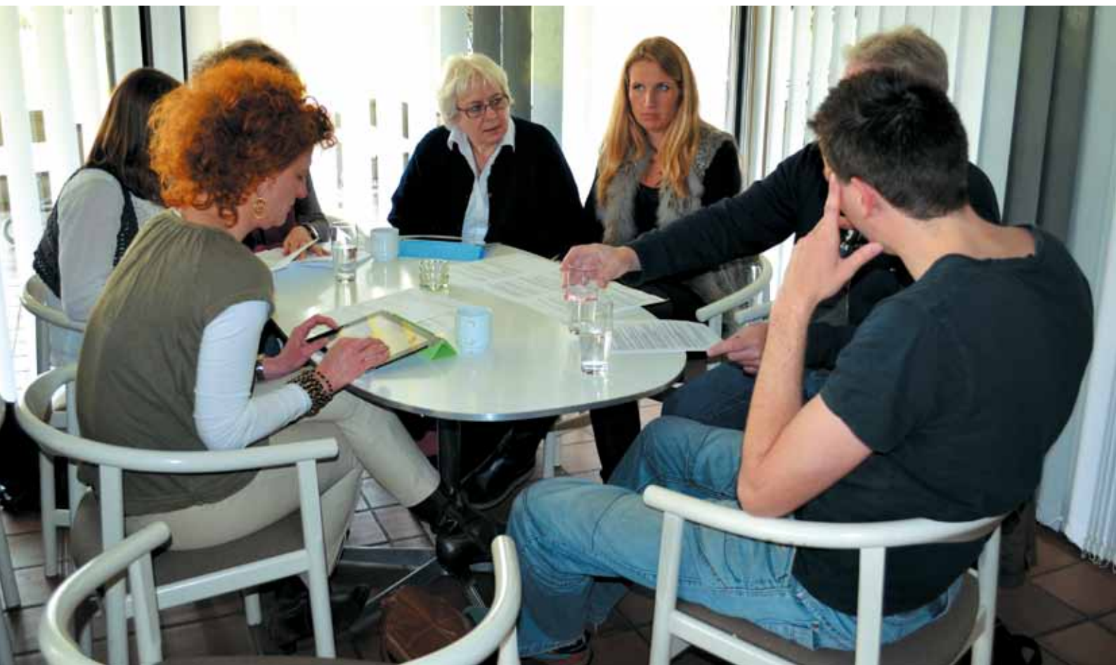
Gruppedrøftelse i Kildeskovshallen vedrørende partnerskabsaftalen

Læreruddannede er de eneste, der er uddannede til at planlægge, gennemføre og evaluere undervisningsforløb i folkeskoleregion. Det enkle, didaktiske destillat af den beskrivelse er, at læreren forestår undervisning, der gør, at eleven tilegner sig viden gennem læring.