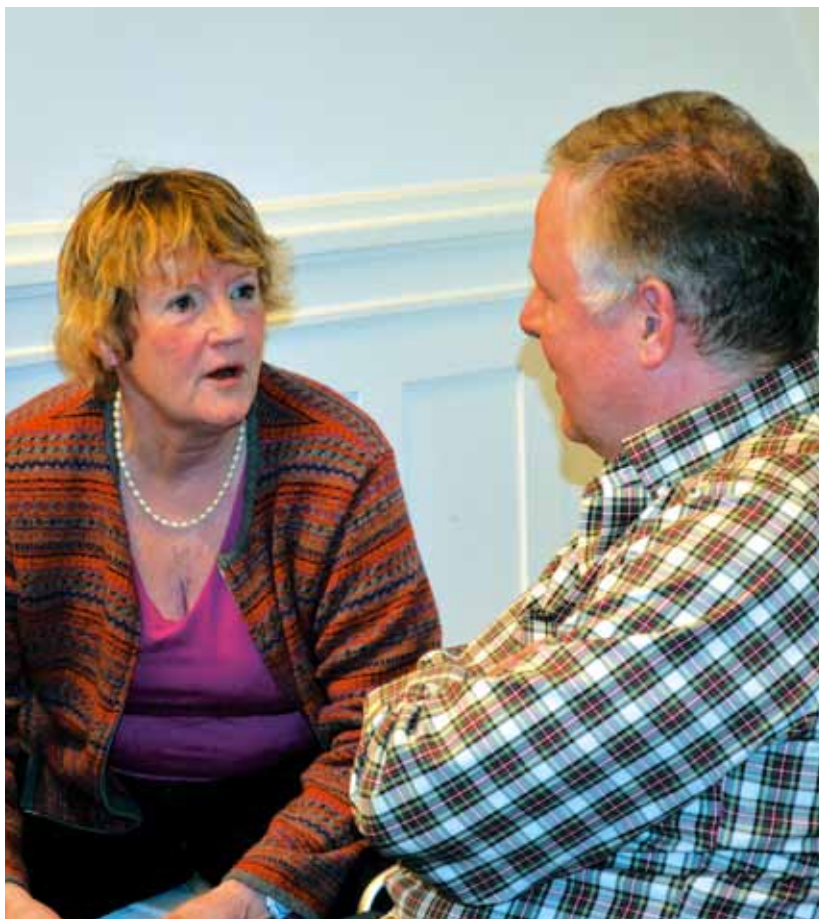
En lydhør TR

om sundhed, service, beskæftigelse og undervisning. Endvidere er det målet at sikre mennesker med komplekse kommunikationshandicap ret til en rehabiliteringsplan, der følger dem på tværs af sektorer. Indholdet skal udfyldes der, hvor der er kompetence til at vurdere behovet for rehabiliteringen, og skal være forpligtende for den myndighed, der skal udøve indsatsen.