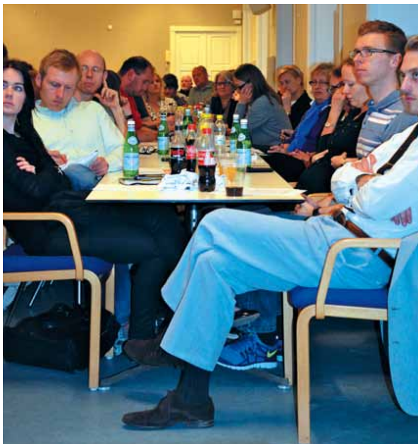
Lydhørhed under oplæsning af mundtlig beretning

Den overordnede beslutning om at inkludere flere elever i normalundervisningen er taget – pengene er sparet. Kun en mindre del er lagt tilbage som en omstillingspulje, som i øvrigt bliver målrettet vision Læring uden grænser, og derfor har fokus langt ud over specialundervisningen og den specialpædagogiske indsats til børn med særlige behov. Inklusion af flere elever er en stor udfordring for skolerne, for lærerne og for de klasser der involveres. Den enkelte lærer må ikke stå alene med den store opgave, det er, når kravet er øget inklusion. Forvaltningen har lavet en overordnet afdækning af området, men der