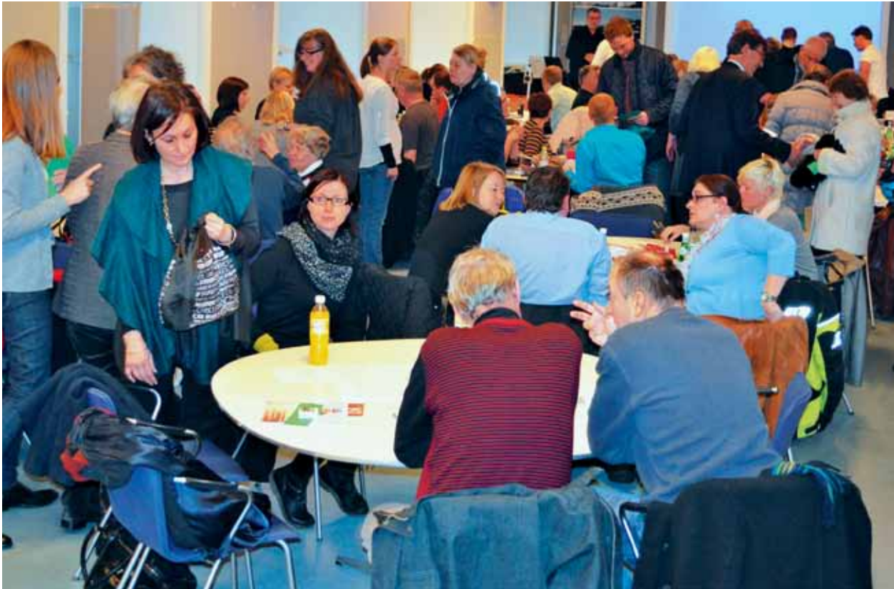
En strække-ben pause