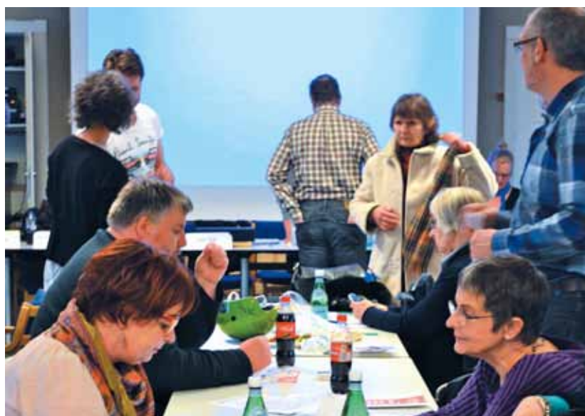
Deltagerne drøfter beretningen

Overenskomst 2013 er så småt gået ind i den fase, hvor kravene bliver diskuteret, og der er ingen tvivl om, at præmisserne for OK-13 er ekstremt vanskelige og hårdt udfordret af den økonomiske virkelighed. Når vi ser på resultaterne, der netop er indgået på det private område, viser det med al tydelighed, at indholdet i den kommende overenskomst lader meget tilbage at ønske.