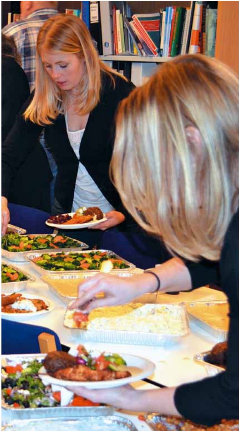
Aftensmaden er ret indbydende, siges der

Med disse ord overgiver jeg beretningen, den skriftlige og den mundtlige, til generalforsamlingens konstruktive drøftelse. ■