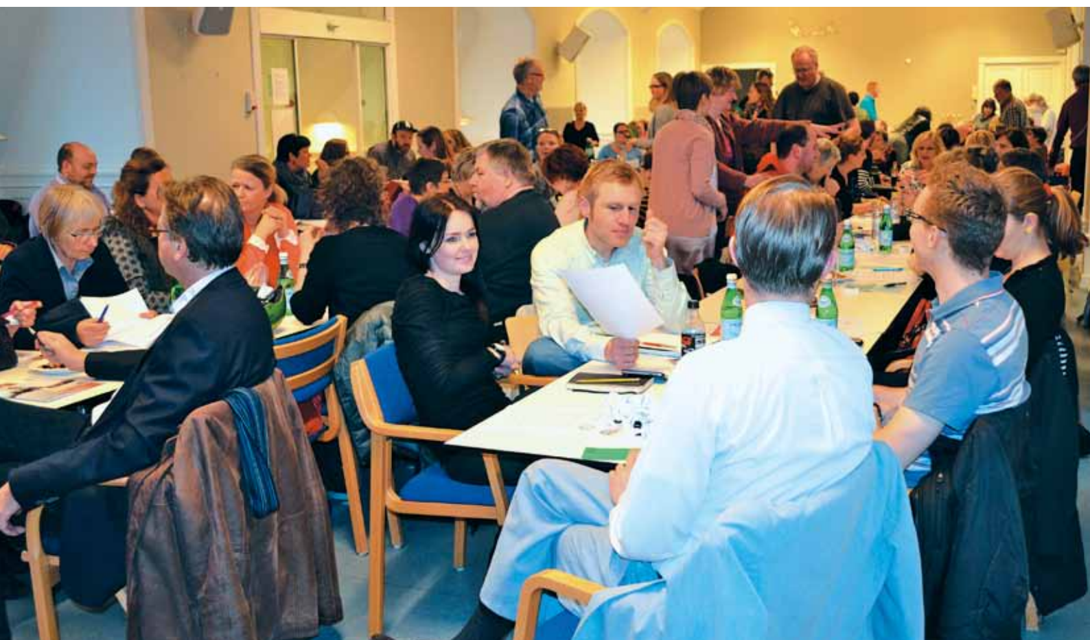
Resolutionerne debatteres og justeres