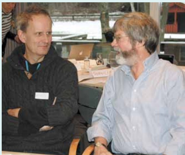
Kollegial snak på internettet på Frederiksdal.

Man kunne vel også med større ret sige at Ny Nordisk Skole er en "død sild", da forudsætning for lærernes opbakning på mindst 85 % ikke længere er tilstede.