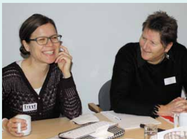
Deltagere på foreningens internat på Frederiksdal.

Et par kommuner har ønsket abonnementsordning på centrets ydelser.