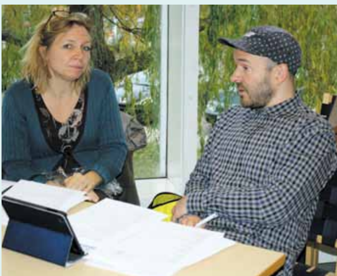
Infomøde vedrørende Lov 409.

Herudover handlede kurset om at gøre de tillidsvalgte operative i forhold til ledelsernes dagsordner med reform og arbejdstidsregler. Steen Nepper Larsen