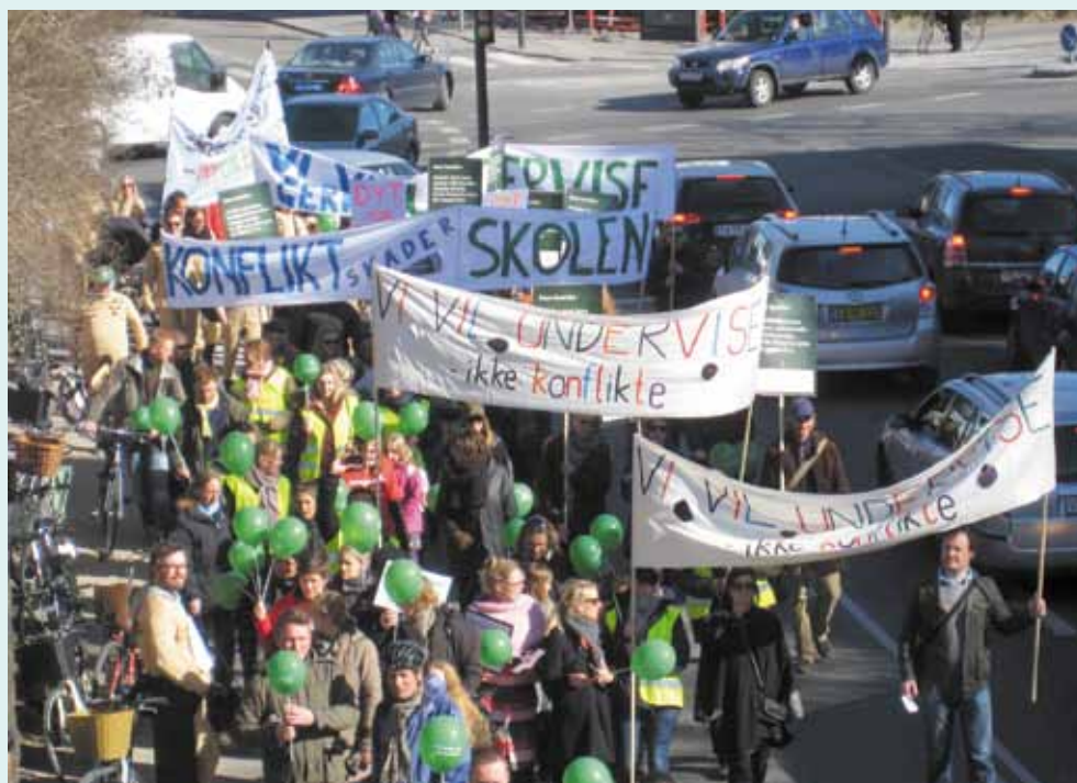
Demonstrationen på vej til Gentofte Rådhus.

Det kæmpe engagement var det, der bar os igennem det mest dramatiske