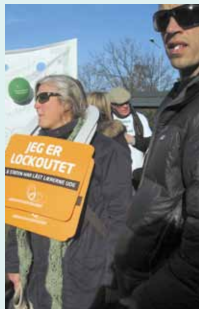
Demonstranter ved GKL's hus.

I denne tid er det knap et år siden, at lærerne modtog meddelelsen om lockout, som KL's magtdemonstration i det der ellers kunne have været forhandlinger om lærernes arbejdsvilkår. Med varslet fulgte en historisk situation, som vi skulle forberede os på. Vi forsøgte at fastholde de positive og fremadrette forhandlinger med forvaltningen til det sidste, men som bekendt viste kommunen ikke de store ønsker om igennem fælles aftaler at sikre den positive fremdrift og udvikling, vi har kendt fra de seneste år. Lockouten blev en realitet den 1. april, og de overenskomstansatte lærere var ikke længere velkomne på skolerne. Stormødet på Travbanen blev begyndelsen på 4 opslidende uger, der brændmærkede sig ind i lærernes bevidsthed. Det blev fire uger, hvor lærernes sammenhold og idérigdom opnåede helt ny dimensio-