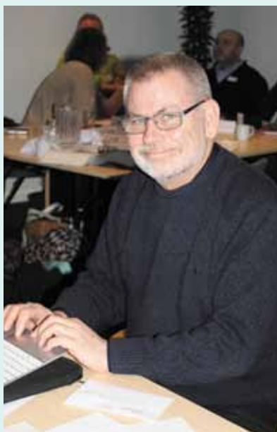
Internatet på Frederiksdal.