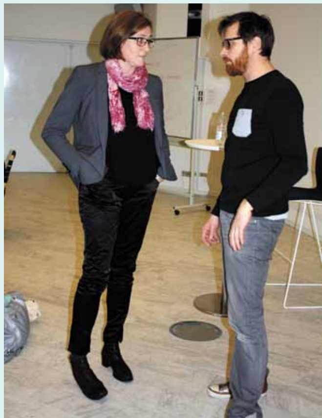
Så er der spørgetid!

Generalforsamlingen er kredsens øverste myndighed. Det er her, at du som medlem har mulighed for at få indflydelse på, hvem der skal tegne det politiske arbejde og i hvilken retning. Så derfor - en opfordring til at møde op til generalforsamlingen, for at deltage i den drøftelse, der skal tegne foreningen. ■