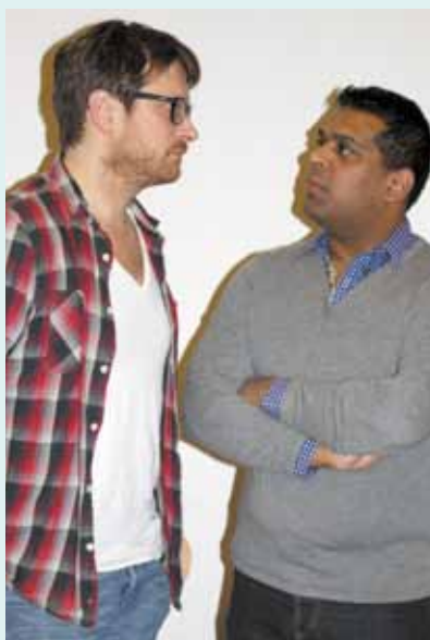
Formandskabet drøfter udviklingen.

møderne sker der løbende en erfaringsudveksling inden for de vigtigste fagpolitiske dagsordner. I 2013 har det hovedsagligt været lockouten og de dybe spor, som retorikken om lærernes arbejde har trukket, og følgerne af reformen og angrebet på den aftale, der var om lærernes arbejdstid. Kredssamarbejdet omfatter også kurser for tillidsrepræsentanter, arbejdsmiljørepræsentanter og kred-