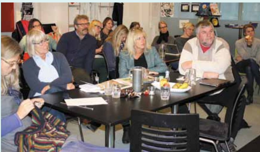
Faglig Klub på Søgårdsskolen.

I kredsstyrelsen har vi forsøgt at fastholde det sammenhold, som lockouten skabte. Lærernes Dag den 5. oktober markerede vi en iskold dag med grill og god stemning og uformelle snakke om minder og erfaringer fra skolerne. Der var god stemning, og næsten alle skoler var repræsenteret.