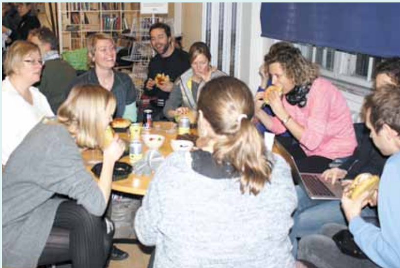
Ekstraordinær generalforsamling på Maglegårdsskolen.

blemstillingen har vi arbejdet videre for at få en aftale, der kan rumme de forskellige interesser, som har været bragt i spil på generalforsamlingen. I skrivende stund er endnu intet underskrevet, men vi er blevet enige med forvaltningens repræsentanter