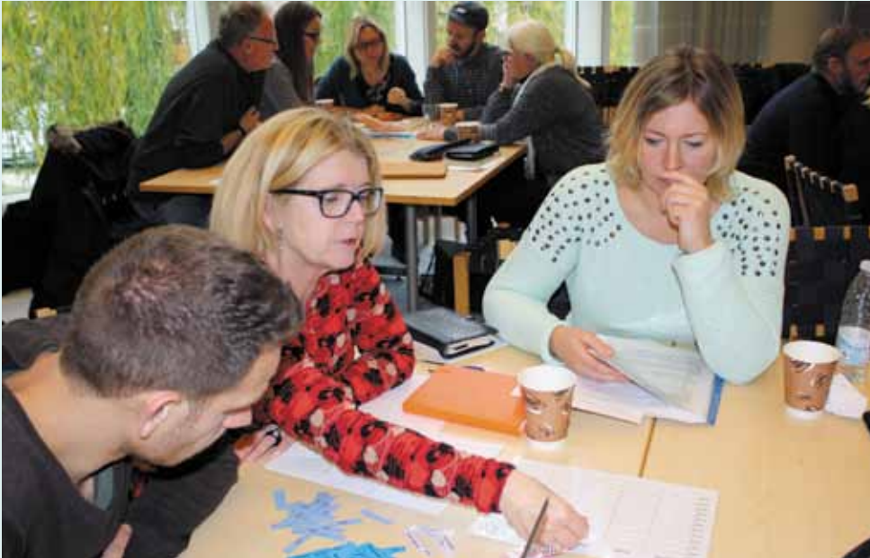
Hvordan kommer den nye hverdag mon til at se ud?

Håbet er, at også andre kommuner vil kunne se fordelene ved en sådan ordning, der både vil forenkle arbejdsgange og virke stabiliserende på økonomien.