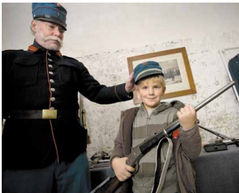
Undervisningen på Garderhøjfortet tager udgangspunkt i fortet og den historiske periode, som det blev bygget i.