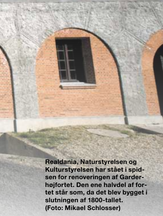
Realdania, Naturstyrelsen og Kulturstyrelsen har stået i spidsen for renoveringen af Garderhøjfortet. Den ene halvdel af fortet står som, da det blev bygget i slutningen af 1800-tallet.

Og undervisningen kommer ikke til at presse skolerne på pengepungen. Den er nemlig gratis, når entreen er betalt, fordi Gentofte Kommune støtter den daglige drift af Garderhøjfortet.