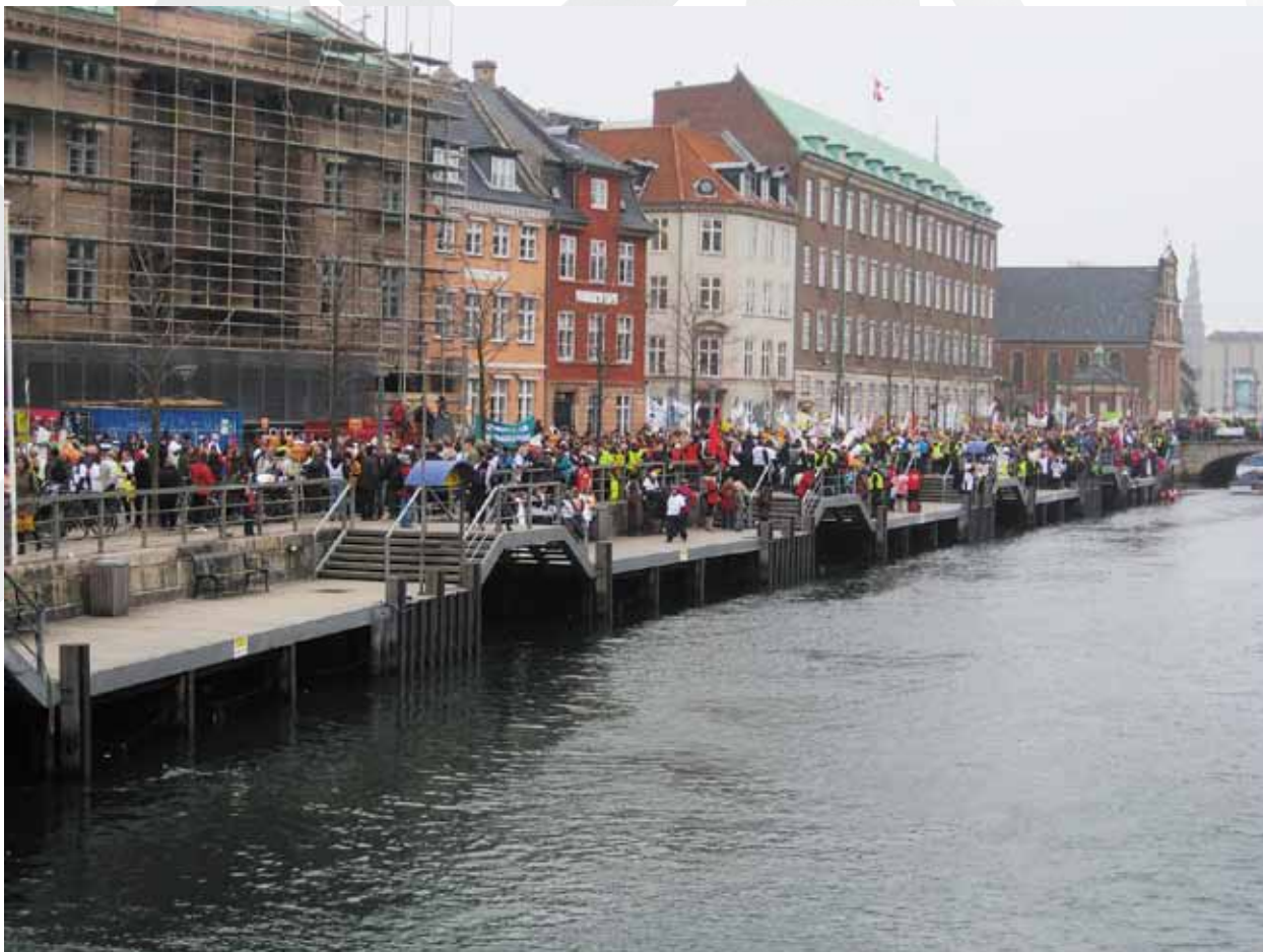
Demonstration 11. april 2013.

Danmarks Lærerforening vil til staidighed arbejde for lærernes mulighed for at give eleverne undervisning på de bedst mulige vilkår. Foreningen har vedtaget 'Professionsideal for Danmarks Lærerforening', hvor ideallet for lærerarbejdet er nærmere beskrevet. Læs foreningens professionsideal på Danmarks Lærerforenings hjemmeside http://www.dlf.org/undervisning/profession+og+kompetence/professionsideal