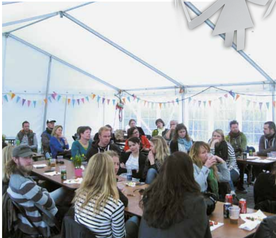
Fra lockouten. Aktivitetsplanlægning i teltet Hellerupvej 44.

munale kredsftaler om arbejdstid og løn og ved at indgå i drøftelser med kommunerne om opgavevaretagelsen. Et samarbejde, der i vid udstrækning har kommet både eleverne, lærerne og kommunerne til gode. Den ro og det fælles ansvar, lokalftalerne har skabt, har gennem tiden gjort, at mange uoverensstemmelser har kunnet løses tæt på de implicerede parter lokalt på arbejdspladserne uden store sværds slag. Det er af stor værdi for sammenhængskraften på arbejdspladsen, og det er ubureaukratisk og effektivt set ud fra et driftsmæssigt synspunkt. Samarbejdet har været med til at sikre ledelserne og den kommunale forvaltning en god skoleudvikling, kvalitet