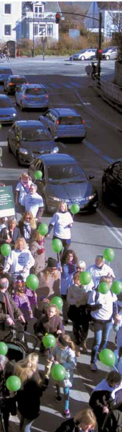
GKLs demonstration 4. april 2013.

munale kredsftaler om arbejdstid og løn og ved at indgå i drøftelser med kommunerne om opgavevaretagelsen. Et samarbejde, der i vid udstrækning har kommet både eleverne, lærerne og kommunerne til gode. Den ro og det fælles ansvar, lokalftalerne har skabt, har gennem tiden gjort, at mange uoverensstemmelser har kunnet løses tæt på de implicerede parter lokalt på arbejdspladserne uden store sværds slag. Det er af stor værdi for sammenhængskraften på arbejdspladsen, og det er ubureaukratisk og effektivt set ud fra et driftsmæssigt synspunkt. Samarbejdet har været med til at sikre ledelserne og den kommunale forvaltning en god skoleudvikling, kvalitet