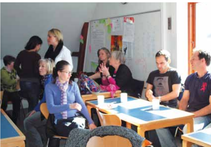
CIS er også lockoutet

Vi har en oplevelse af, at de udsatte elever på nuværende tidspunkt ikke får den undervisning, de har behov for og krav på. Det medfører mistrivsel og uro og dermed en voldsom belastning af elevernes undervisningsmiljø og lærernes arbejdsmiljø. Det er naturligvis skolelederen, der i sidste ende står med ansvaret for såvel undervisningsmiljø som arbejdsmiljø. Men de økonomiske forudsætninger er altså sat op af kommunen, og det er derfor svært at bebrejde lederne.