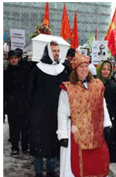
Her begravnes den danske model

Det er absurd at stå i den situation, hvor vi for cirka 4 uger siden så hele resultatet blive kastet på gulvet af kommunen. Og det var altså inden, lockouten overhovedet var blevet varslet. GKL har siden rettet henvendelse ad flere omgange til både kommunalbestyrelsen og skolebestyrelserne. Vi har opfordret kommunen til at genoptage forhandlingerne og lægge afstand til KL's krigeriske konfrontationsretorik. Men selvom Gentofte Kommune har en mulighed for sammen med GKL at vise, at lokalt samarbejde kan vise vejen og være en forudsætning for sammen at gøre en god skole bedre, oplever vi nu kommunens optrapning af konflikten, hvor man i flere tilfælde bringer konflikten hele vejen ind på skolerne i Gentofte. Under parolen: "Lærerne er de første. Hvem bliver de næste?" var rigtig mange lærere i går samlet på Christiansborgs Slotsplads sammen med en lang række andre organisationer for at vise utilfredsheden med politikernes utidige indblanding i overenskomstforhandlingerne. For nylig stod vi skulder ved skulder med