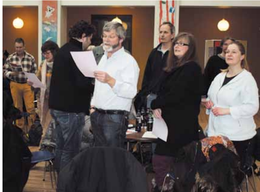
Foreningssangen synges stående – naturligvis!