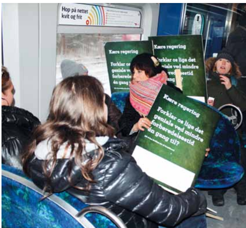
I toget på vej til Christiansborg

Vores arbejdsgivere tror i deres ophøjede uvidenhed på, at man skal bruge mindre forberedelsestid til flere undervisningstimer for at sikre undervisningens kvalitet – nonsens! Og som det nok er gået op for de fleste af jer, har det lokalt i Gentofte bragt os i en grotesk situation, hvor vi, siden Gentofte Kommune opsagde vores nuværende arbejdstidsaftale