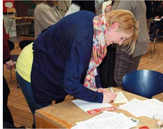
Mon jeg vinder

Lige nu er det helt usikkert, hvor vi ender henne med den konflikt, vi står i. KL's udspil til forhandlingerne har været temmelig indholdstomt. Der har været tale om, at lærerne bare skal have en arbejdstid på 1924 timer, og så arbejder man fleksibelt under skolelederens ledelsesret over opgavernes fordeling. Men den "normalisering" af lærernes arbejdstid, som KL