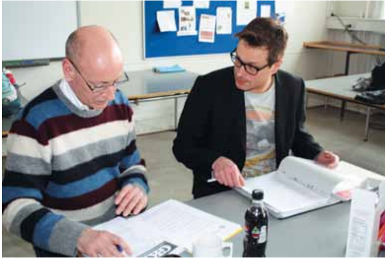
Forberedelsen er vigtig

finansieringsbehov, når regeringens reformudspil lægger op til, at eleverne kan se frem til langt flere undervisningstimer end i dag. KL's opskrift er enkel og i øvrigt uden egentlig forklaring på, hvordan det skal kunne lade sig gøre i praksis – de vil blot have lærerne til at undervise mere og give de enkelte skoleledere magten til at administrere arbejdstiden. Vi, der ved noget om skole, ved, at det vil gå ud over fleksibiliteten og ikke mindst kvaliteten af undervisningen. I oktober 2012 fremlagde regeringen et forslag til en ny folkeskolereform, der vil lave folkeskolen om til en heldagsskole. Reformen påvirker den nuværende strid om overenskomst,