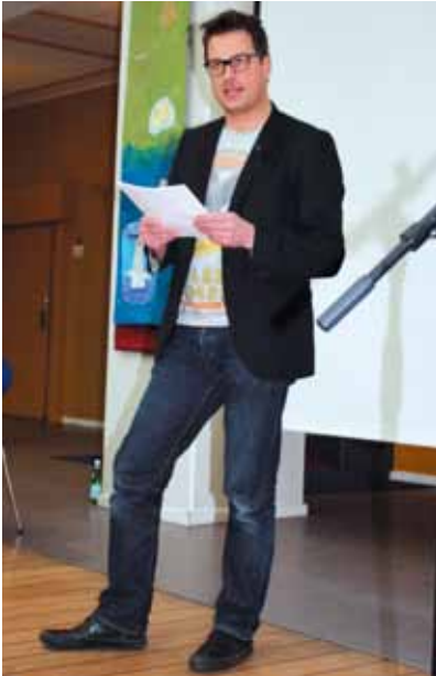
Formanden aflægger beretning