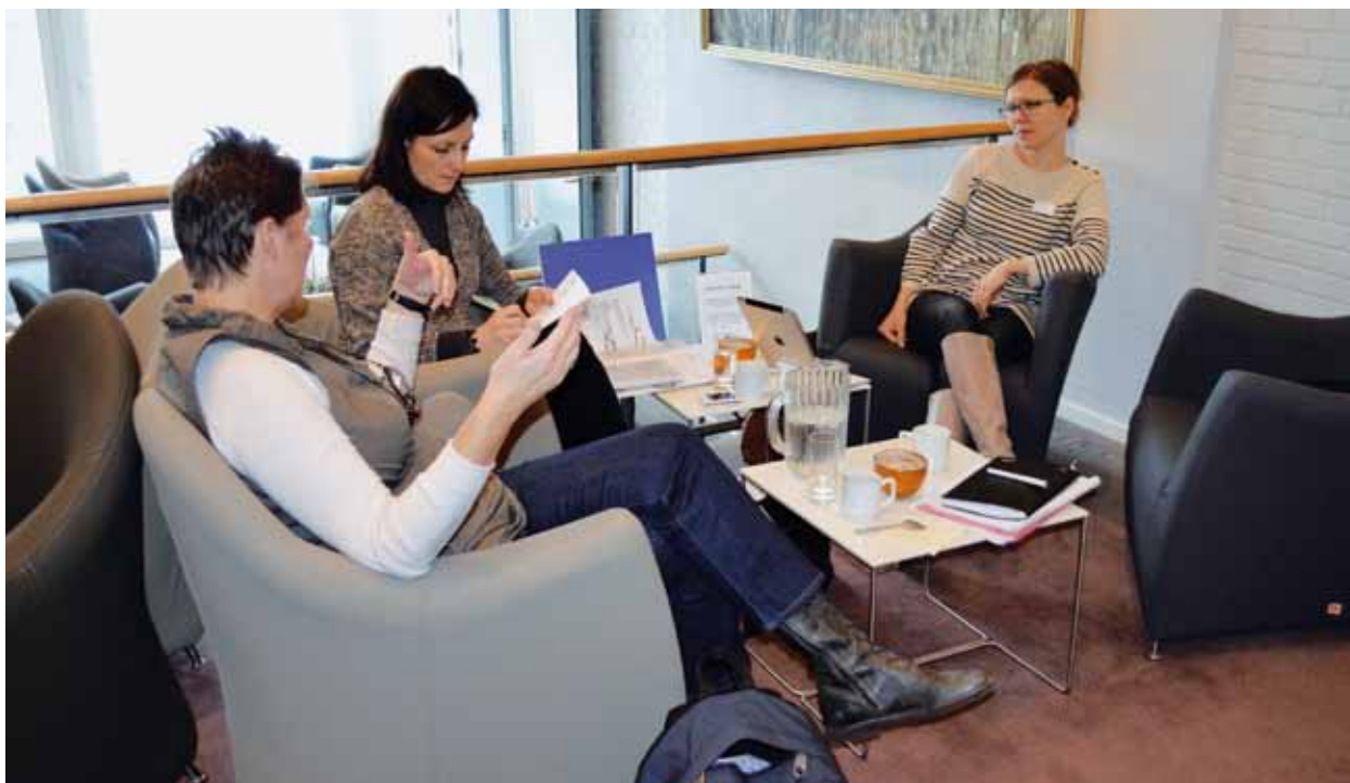
Gruppedrøftelser på Frederiksdal.

Kendskabet til de kommunale strategier og værktøjer til at løse udfordringerne er ikke godt nok, og et arbejde med at understøtte lærernes muligheder for at løse opgaverne står for døren.