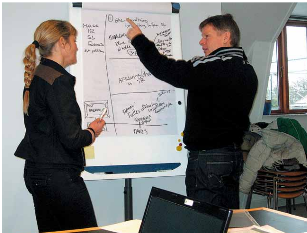
DLF-konsulenter arbejder også for GKL