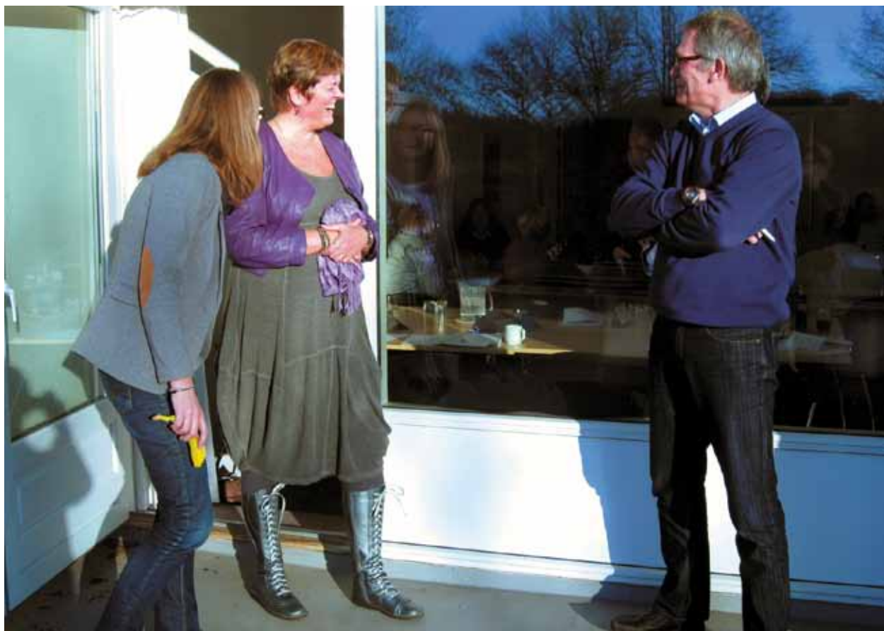
Grinepause på Frederiksdal

en mere smidig mødeafholdelse. Der er plads til større medinddragelse, og møderne er generelt blevet mere vedkommende.